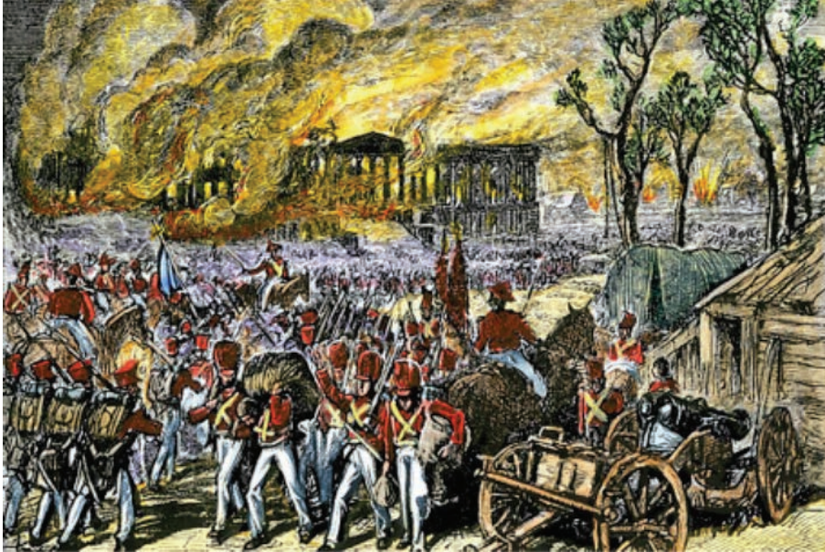
El ejército británico incendia la Casa Blanca