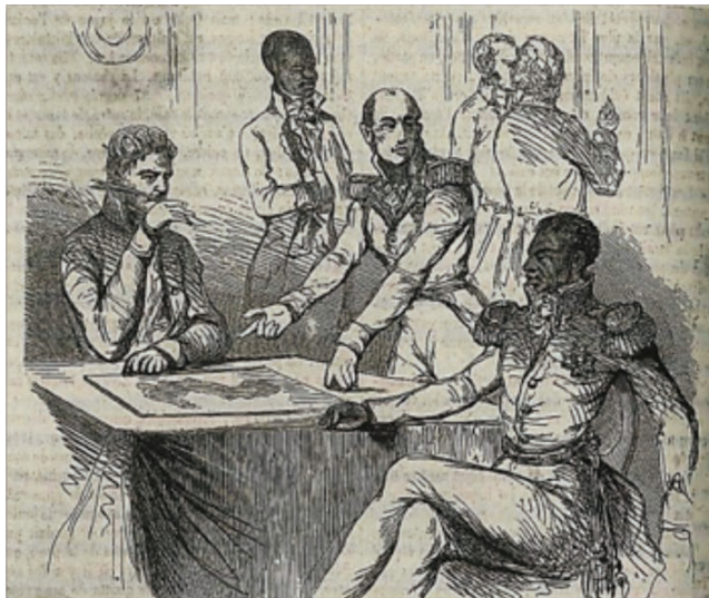
Tratado de defensa mutua firmado por Toussaint Louverture (Haití), Edward Stevens (Estados Unidos) y Thomas Maitland (Inglaterra), 13 de junio de 1779